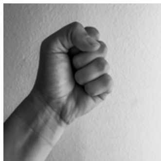
Nummer 0 bzw. 10